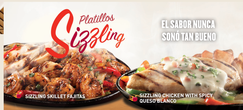
SIZZLING SKILLET FAJITAS

Costillitas de cerdo cocinadas lentamente y bañadas con salsa BBQ o si lo prefieres con salsa Southern BBQ o sweet & spicy. Servido con papas fritas y elote. $159