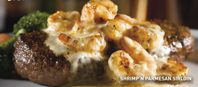
SHRIMP 'N PARMESAN SIRLOIN