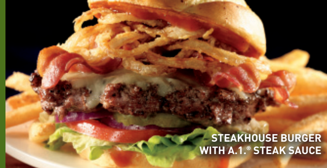
STEAKHOUSE BURGER WITH A.1.® STEAK SAUCE