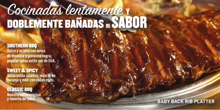
BABY BACK RIB PLATTER

Camarones bañados en una salsa Teriyaki sobre una cama de pasta penne integral. Mezclado con deliciosos vegetales y espolvoreados de fresco cilantro. Adornado con un gajo de limón para resaltar el sabor dulce y cítrico del Teriyaki. $119 Prueba también el Teriyaki Chicken Pasta. $109