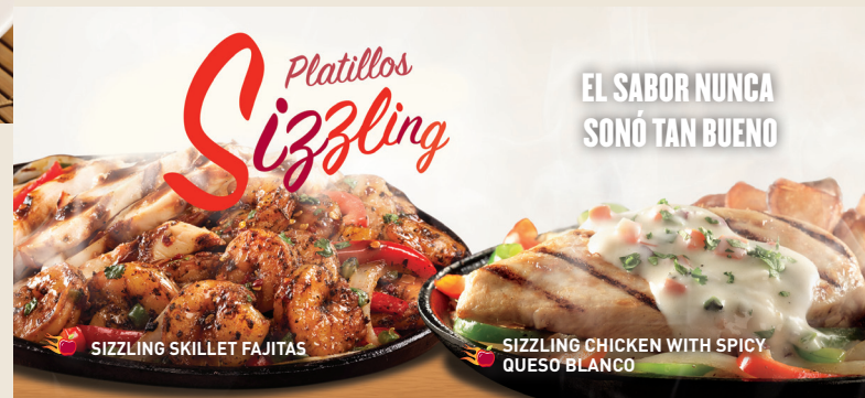
SIZZLING SKILLET FAJITAS

Costillitas de cerdo cocinadas lentamente y bañadas con salsa BBQ o si lo prefieres con salsa Southern BBQ o sweet & spicy. Servido con papas fritas y elote. $159