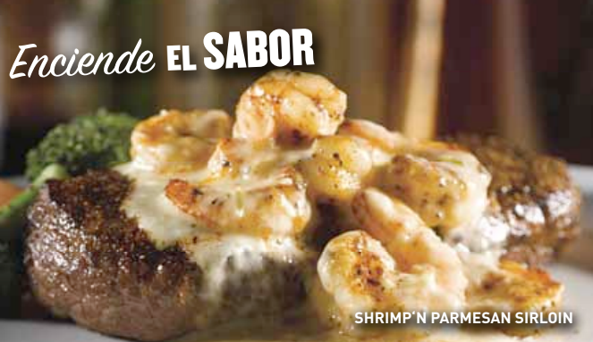
SHRIMP 'N PARMESAN SIRLOIN