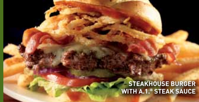
STEAKHOUSE BURGER WITH A.1.® STEAK SAUCE