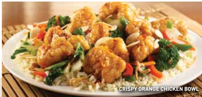
CRISPY ORANGE CHICKEN BOWL

Ligera combinación de lechugas, tomate picado, pepino en cubos, queso Jack Cheddar rallado, tocino picado, crotones y aderezo al gusto. $74