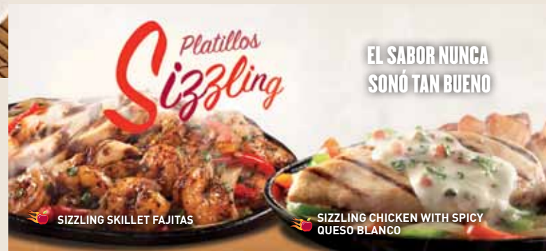
SIZZLING SKILLET FAJITAS

Costillitas de cerdo cocinadas lentamente y bañadas con salsa BBQ o si lo prefieres con salsa Southern BBQ o sweet & spicy. Servido con papas fritas y elote. $159