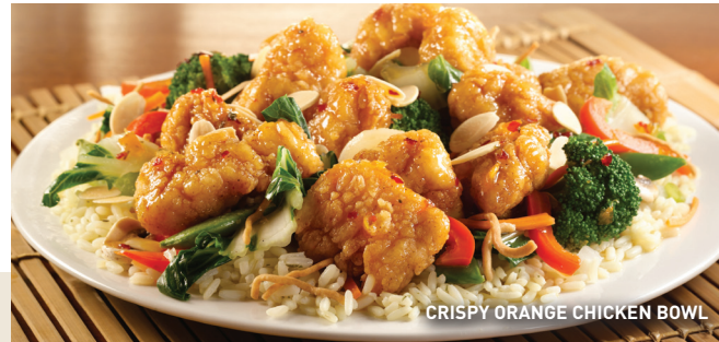
CRISPY ORANGE CHICKEN BOWL

Ligera combinación de lechugas, tomate picado, pepino en cubos, queso Jack Cheddar rallado, tocino picado, crotones y aderezo al gusto. $74