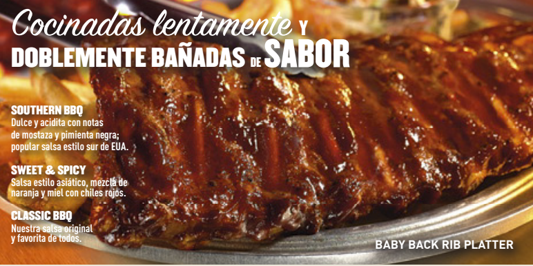
BABY BACK RIB PLATTER

Nuestra salsa original y favorita de todos.