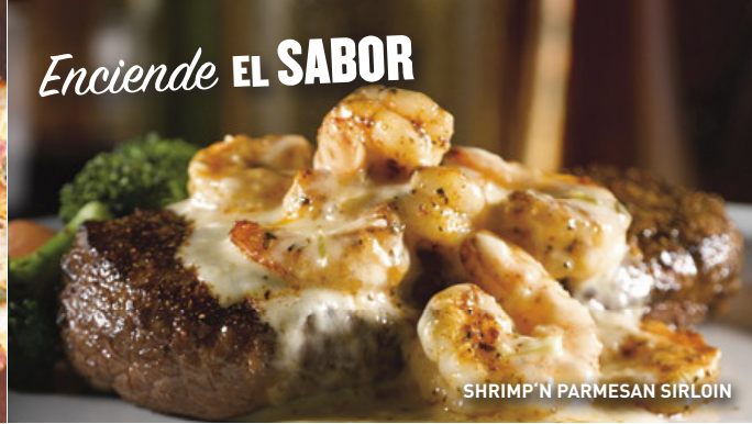
SHRIMP 'N PARMESAN SIRLOIN