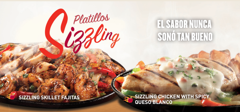
SIZZLING SKILLET FAJITAS

Costillitas de cerdo cocinadas lentamente y bañadas con salsa BBQ o si lo prefieres con salsa Southern BBQ o sweet & spicy. Servido con papas fritas y elote. $159