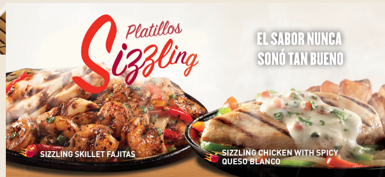
SIZZLING SKILLET FAJITAS

Costillitas de cerdo cocinadas lentamente y bañadas con salsa BBQ o si lo prefieres con salsa Southern BBQ o sweet & spicy. Servido con papas fritas y elote. $154