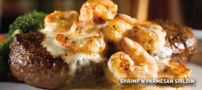
SHRIMP 'N PARMESAN SIRLOIN