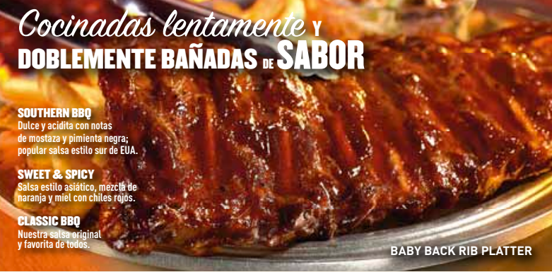
BABY BACK RIB PLATTER

Camarones bañados en una salsa Teriyaki sobre una cama de pasta penne integral. Mezclado con deliciosos vegetales y espolvoreados de fresco cilantro. Adornado con un gajo de limón para resaltar el sabor dulce y cítrico del Teriyaki. $119 Prueba también el Teriyaki Chicken Pasta. $109