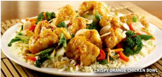
CRISPY ORANGE CHICKEN BOWL

Ligera combinación de lechugas, tomate picado, pepino en cubos, queso Jack Cheddar rallado, tocino picado, crotones y aderezo al gusto. $54