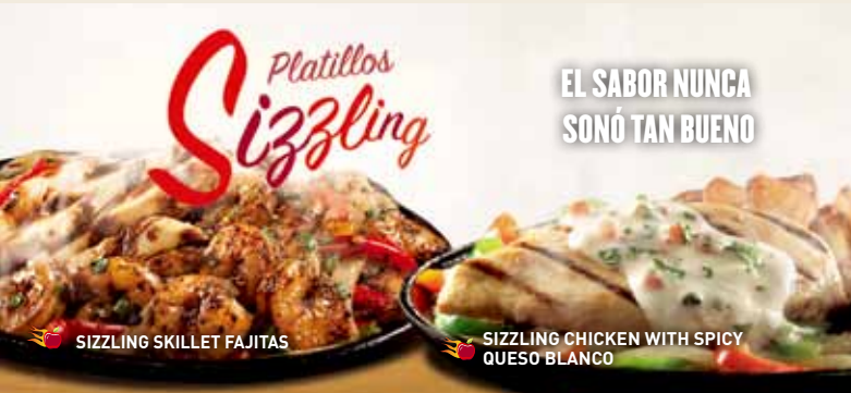
SIZZLING SKILLET FAJITAS

Cada orden de fajitas va acompañada con arroz mexicano, guacamole, crema ácida, pico de gallo, queso Jack cheddar y tortillas.