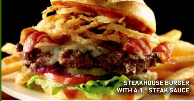
STEAKHOUSE BURGER WITH A.1.® STEAK SAUCE

CD. VICTORIA Blvd. Tamaulipas # 3262 Local 1, Fracc. Villarreal (Plaza Campestre). Cd. Victoria, Tamps. Tel. (834) 316 3114