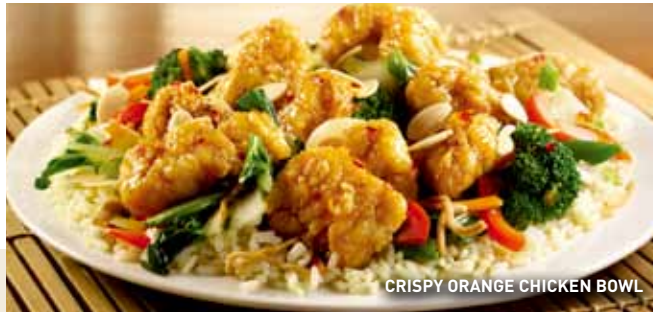
CRISPY ORANGE CHICKEN BOWL

Ligera combinación de lechugas, tomate picado, pepino en cubos, queso Jack Cheddar rallado, tocino picado, crotones y aderezo al gusto. $54