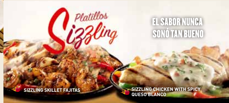
SIZZLING SKILLET FAJITAS

Cada orden de fajitas va acompañada con arroz mexicano, guacamole, crema ácida, pico de gallo, queso Jack cheddar y tortillas.