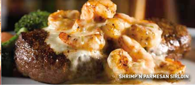
SHRIMP 'N PARMESAN SIRLOIN