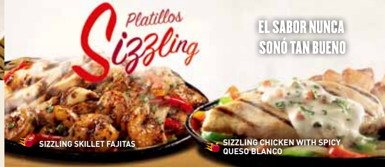
SIZZLING SKILLET FAJITAS

Cada orden de fajitas va acompañada con arroz mexicano, guacamole, crema ácida, pico de gallo, queso Jack cheddar y tortillas.