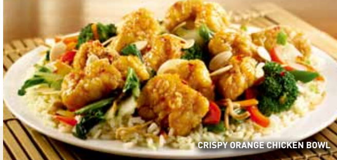
CRISPY ORANGE CHICKEN BOWL

Ligera combinación de lechugas, tomate picado, pepino en cubos, queso Jack Cheddar rallado, tocino picado, crotones y aderezo al gusto. $54