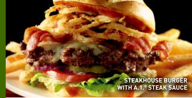
STEAKHOUSE BURGER WITH A.1.® STEAK SAUCE

DURANGO Plaza Comercial Paseo Durango, Felipe Pescador # 1401 Local R01/TR01, Col. Esperanza (Paseo Durango). Durango, Dgo. Tel. (618) 129 2144