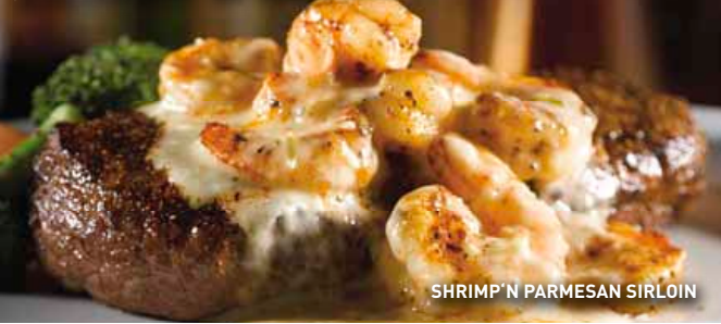
SHRIMP 'N PARMESAN SIRLOIN