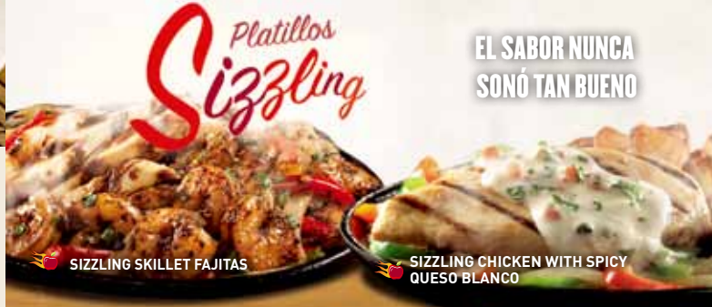
SIZZLING SKILLET FAJITAS

Cada orden de fajitas va acompañada con arroz mexicano, guacamole, crema ácida, pico de gallo, queso Jack cheddar y tortillas.