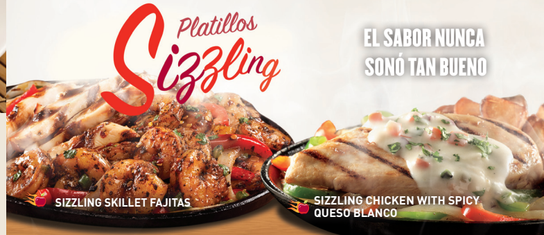
SIZZLING SKILLET FAJITAS

Cada orden de fajitas va acompañada con arroz mexicano, guacamole, crema ácida, pico de gallo, queso Jack cheddar y tortillas.