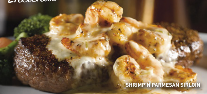
SHRIMP 'N PARMESAN SIRLOIN