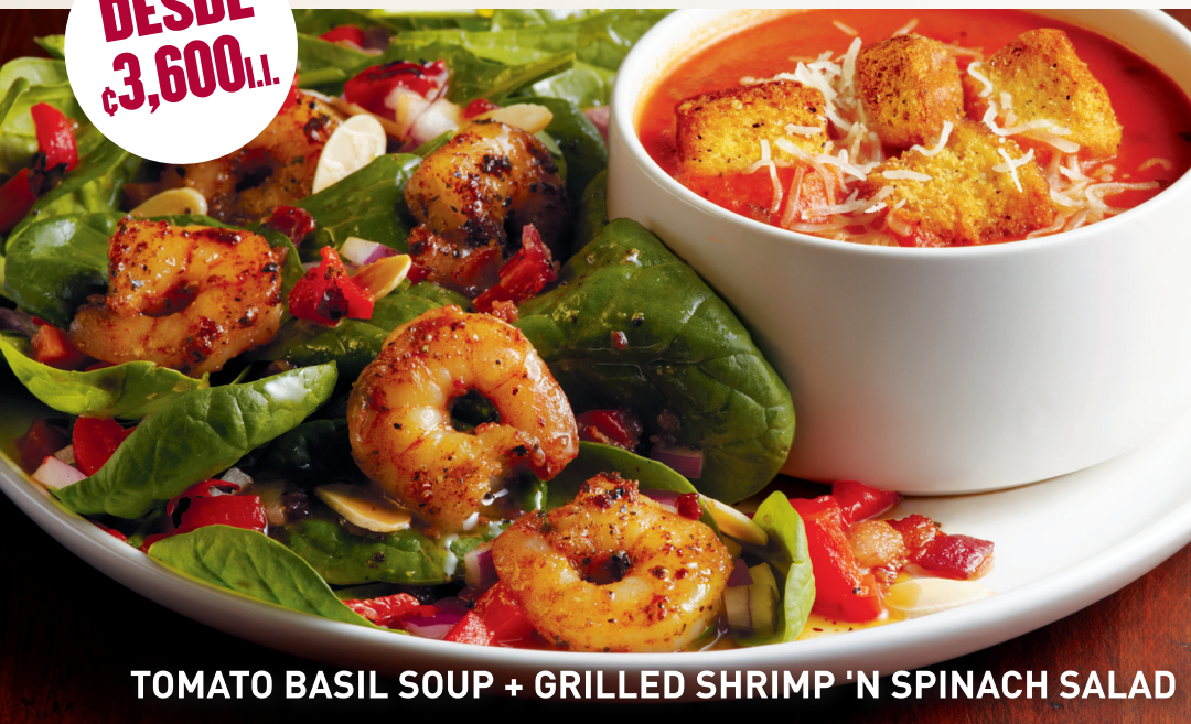
TOMATO BASIL SOUP + GRILLED SHRIMP 'N SPINACH SALAD