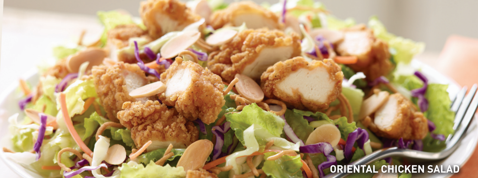
ORIENTAL CHICKEN SALAD