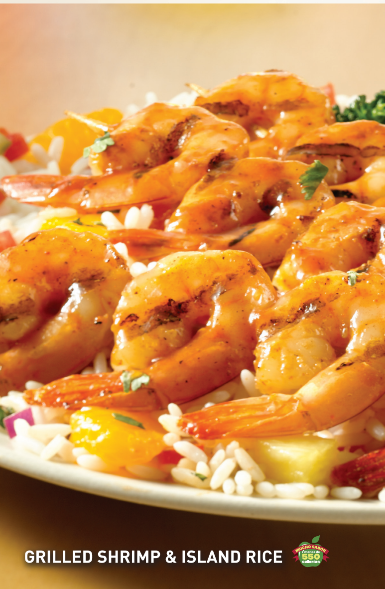
GRILLED SHRIMP & ISLAND RICE