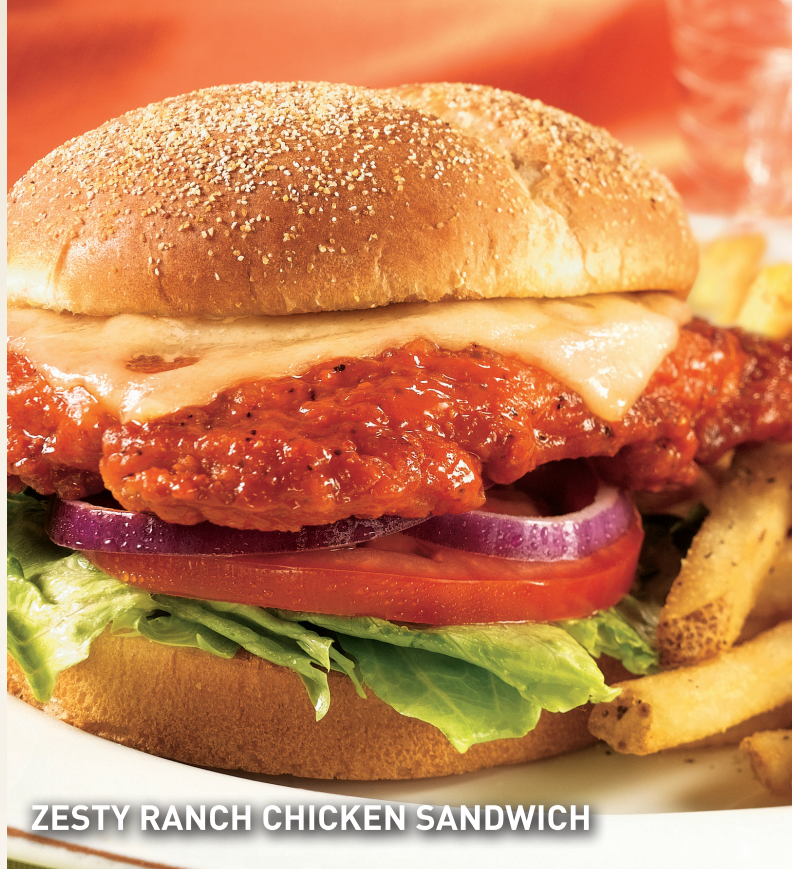
ZESTY RANCH CHICKEN SANDWICH