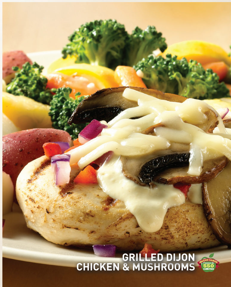
GRILLED DIJON CHICKEN & MUSHROOMS

A nuestros clientes con alergias y sensibilidad a alimentos: Applebee's® no puede asegurar que los platillos no contengan ingredientes que puedan causar una reacción alérgica. Por favor, tómallo en cuenta antes de ordenar.