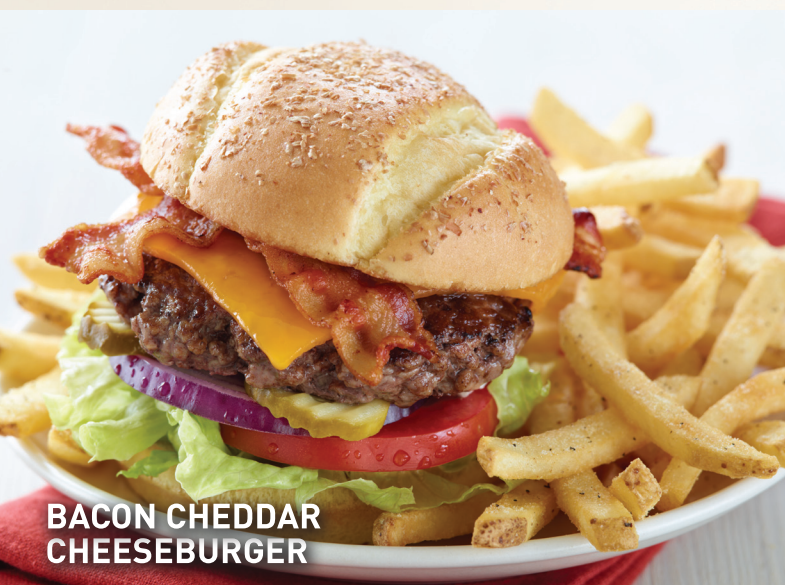
BACON CHEDDAR CHEESEBURGER

Cabalga hacia los sabores del Suroeste. Esta hamburguesa está cubierta con queso Pepper-Jack, jalapeños dulces, mayonesa de chipotle y va servido en un pan de hamburguesa tostado. $6,950i.i.