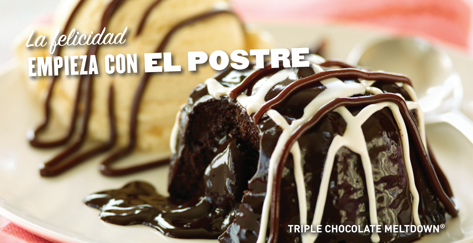
TRIPLE CHOCOLATE MELTDOWN®