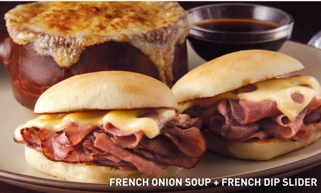
FRENCH ONION SOUP + FRENCH DIP SLIDER

Pregunta a tu server por nuestras limonadas saborizadas, té y fizzers de frutas.