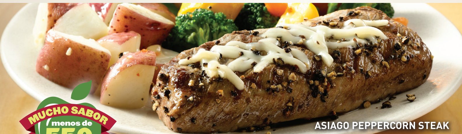
ASIAGO PEPPERCORN STEAK

Nuestra mezcla de ensalada oriental con pollo a la parrilla y salsa asiática teriyaki. Combinado deliciosamente con chile dulce y cebolla morada asados, alverja china, pepino fresco en cubos, almendras rebanadas y culantro. $7,250i.i.