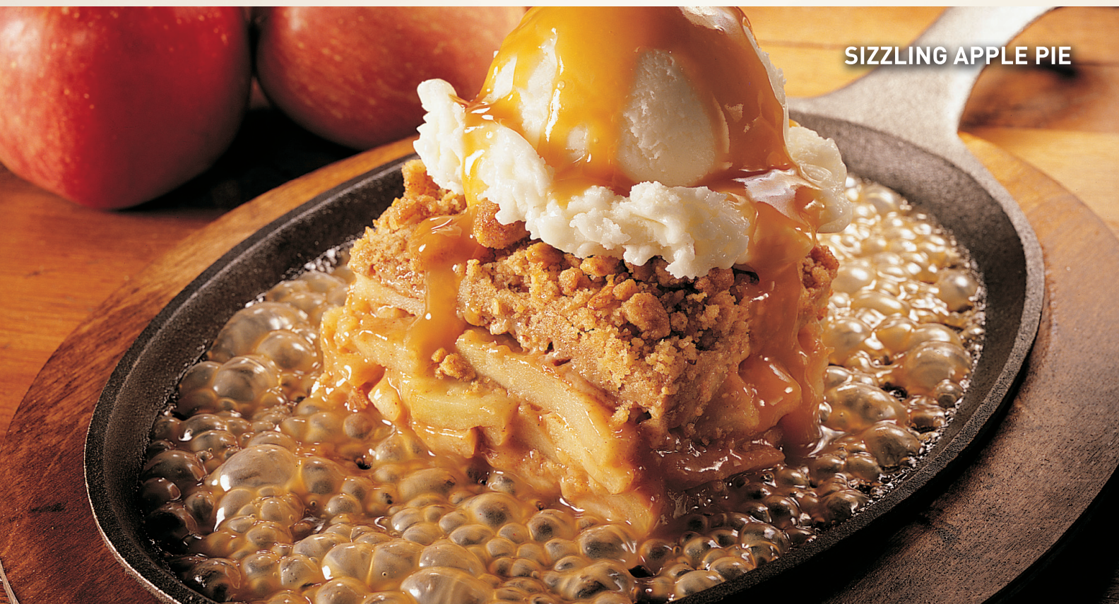
SIZZLING APPLE PIE

©OREO is a registered trademark of Kraft Foods.