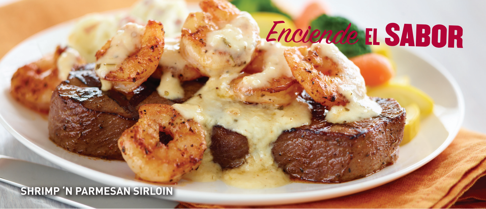
SHRIMP 'N PARMESAN SIRLOIN