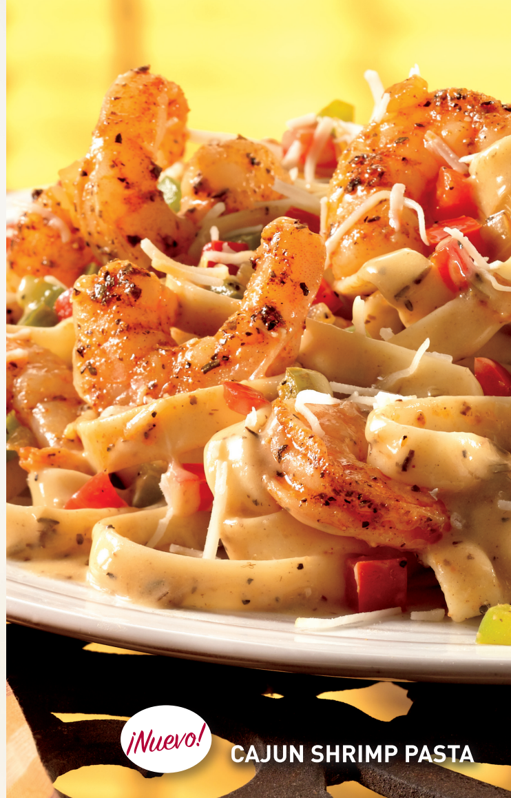
¡Nuevo! CAJUN SHRIMP PASTA

Camarones salteados con sazón blackened, servidos sobre pasta fettuccine y mezclados con una salsa scampi Cajun (contiene mariscos). Acompañados con cebollas salteadas, chiles dulces verde y rojo y espolvoreados con queso Parmesano rallado. Servido con pan de ajo. $9,450i.i.