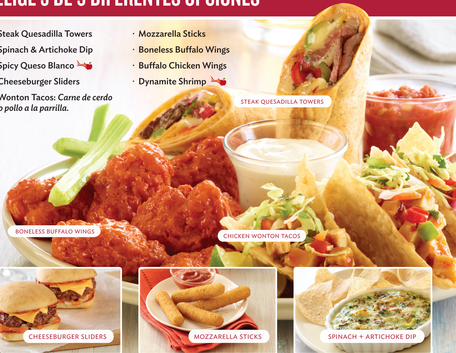
BONELESS BUFFALO WINGS