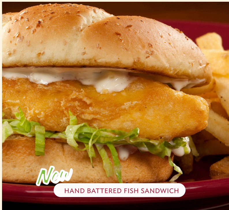
HAND BATTERED FISH SANDWICH