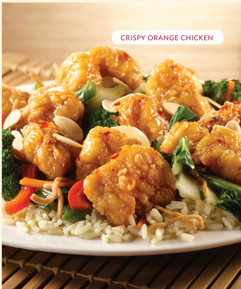
CRISPY ORANGE CHICKEN

Mezcla estilo oriental preparada con crujientes cubitos de pollo empanizados, bañada con nuestra exclusiva Salsa Oriental a la Naranja y servida sobre una cama de arroz pilaf y una mezcla de vegetales. Acompañada con tallarines de arroz tostado y almendras tostadas. → ₺ 9,200 i.i