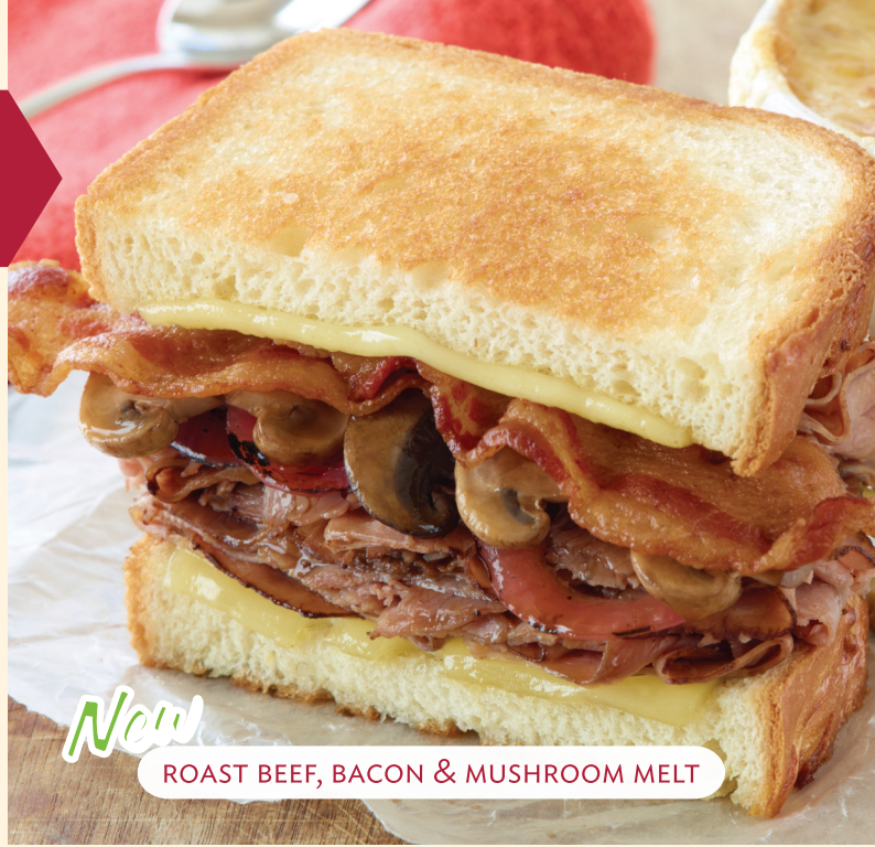
ROAST BEEF, BACON & MUSHROOM MELT

TODOS LOS SÁNDWICHES INCLUYEN PAPAS FRITAS.