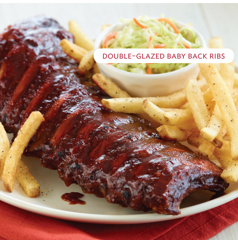
DOUBLE-GLAZED BABY BACK RIBS

Regular → ¢ 10,550 i.i Mediana → ¢ 7,150 i.i