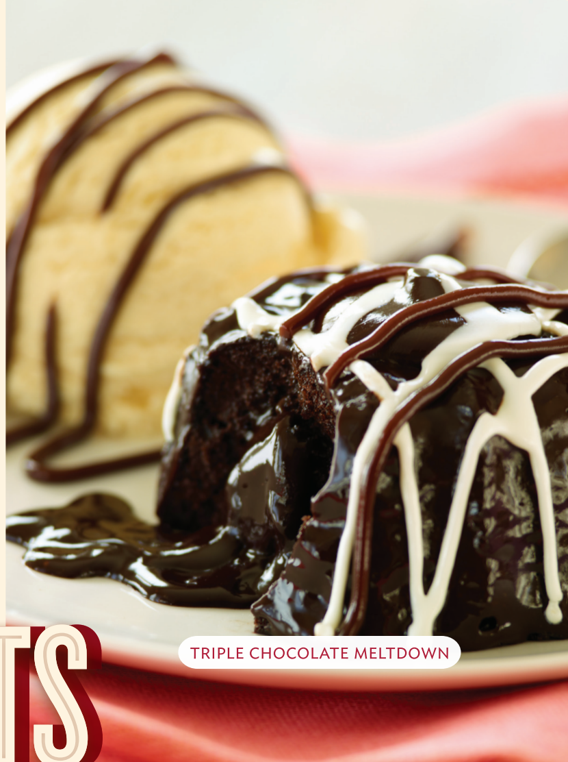
TRIPLE CHOCOLATE MELTDOWN