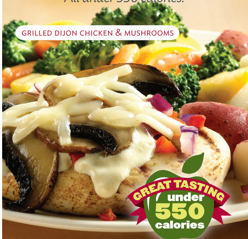
GRILLED DIJON CHICKEN & MUSHROOMS