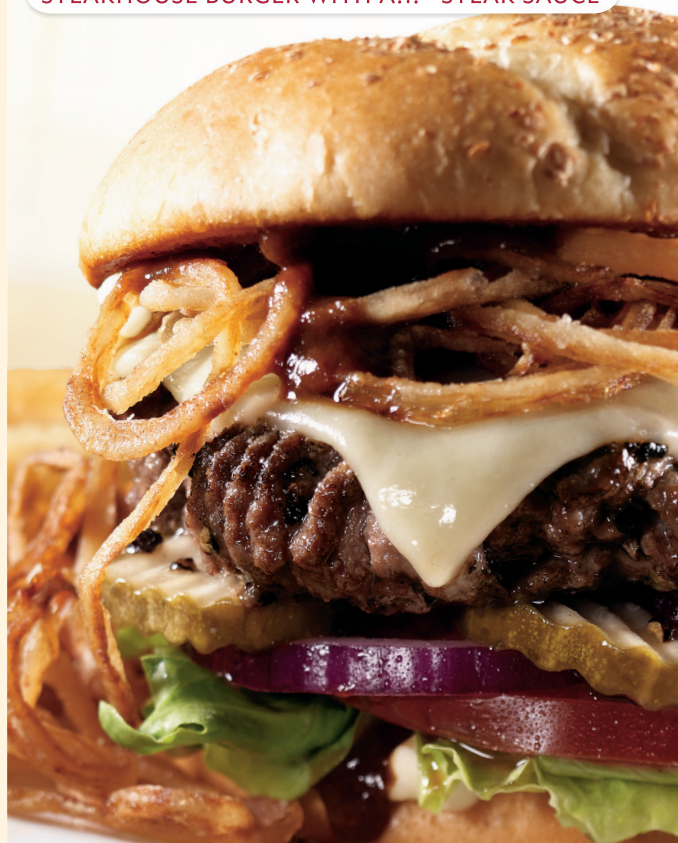
STEAKHOUSE BURGER WITH A.1.® STEAK SAUCE

TODAS LAS HAMBURGUESAS INCLUYEN PAPAS FRITAS.