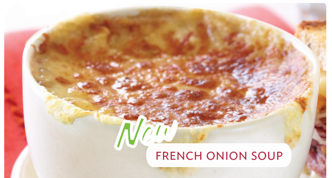
FRENCH ONION SOUP

A nuestros clientes con alergias y sensibilidad a alimentos: Applebee's® no puede asegurar que los platillos no contengan ingredientes que puedan causar una reacción alérgica. Por favor, tómallo en cuenta antes de ordenar.